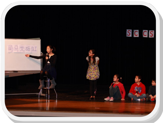
中文4A班—司马光砸缸