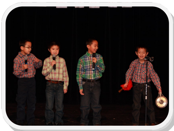
段名文/彭家瑞/焦竞成/林志高一三句半