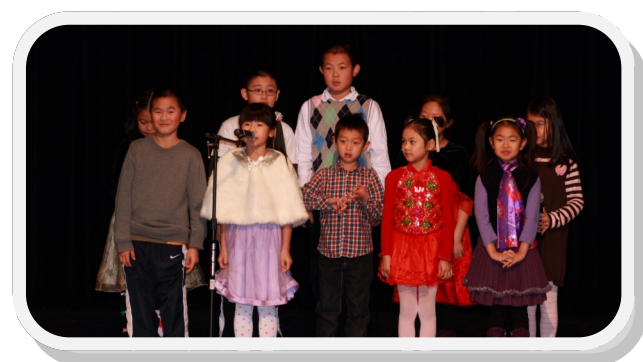
中文三年级—猜一猜