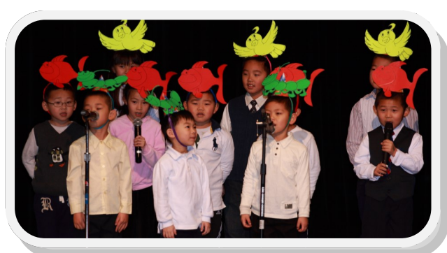
中文1B班 - 小鸟自由地飞